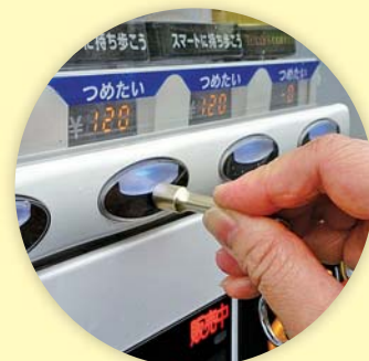
自動販売機 (機械式)