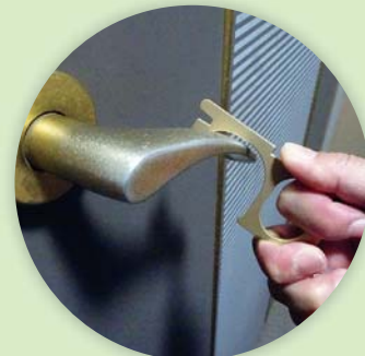
レバーハンドルのドアに