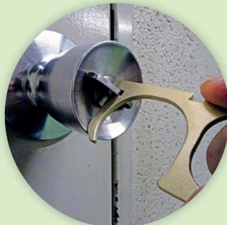
3mmまでのサムターンに