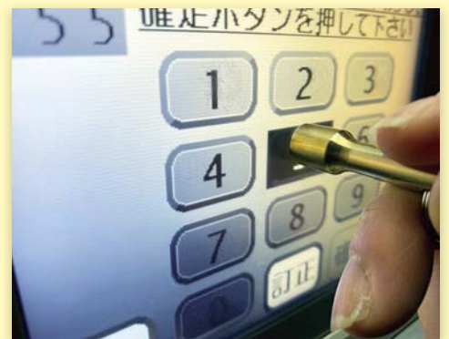
コインパーキングで