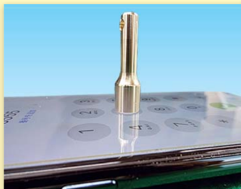
底面でしっかりタッチ

※パネルを強く押ししたり、削ったりすると表面が損傷する場合がありますのでご注意ください。