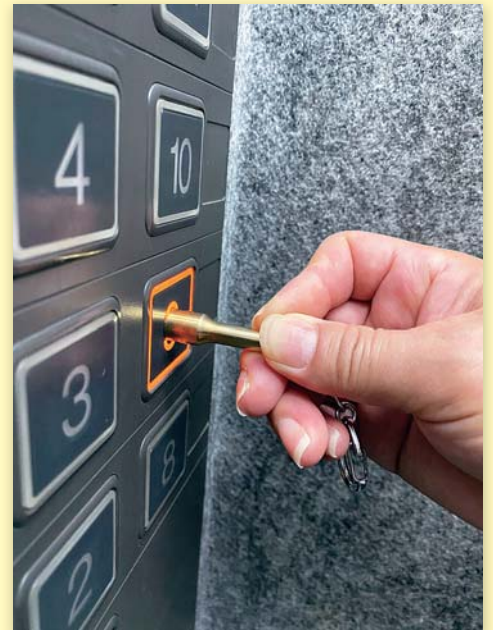
エレベーターのボタンに