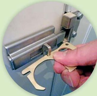
公衆トイレや厚いサムターンに