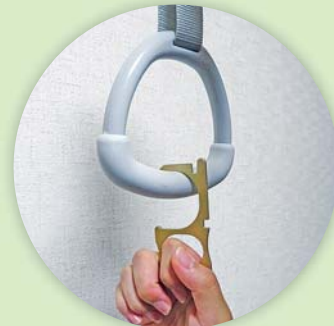
電車・バスの吊革に