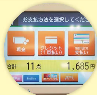
セルフレジ (静電容量式)