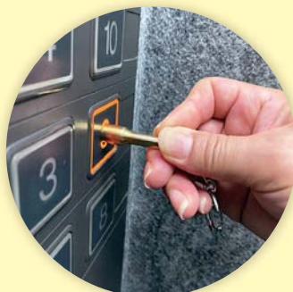
エレベータボタン (機械式)