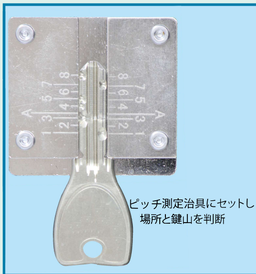
ピッチ測定治具にセットし 場所と鍵山を判断