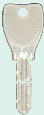
折れてしまった鍵